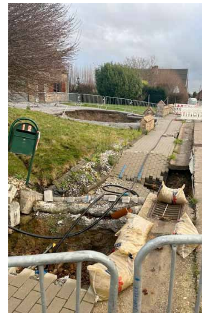
Jonathan GREVESSE 1 er Echevin

Au vu des procédures de marché public en vigueur, nous espérons un début de travaux fin du 2ème trimestre ou début du troisième trimestre de 2024.